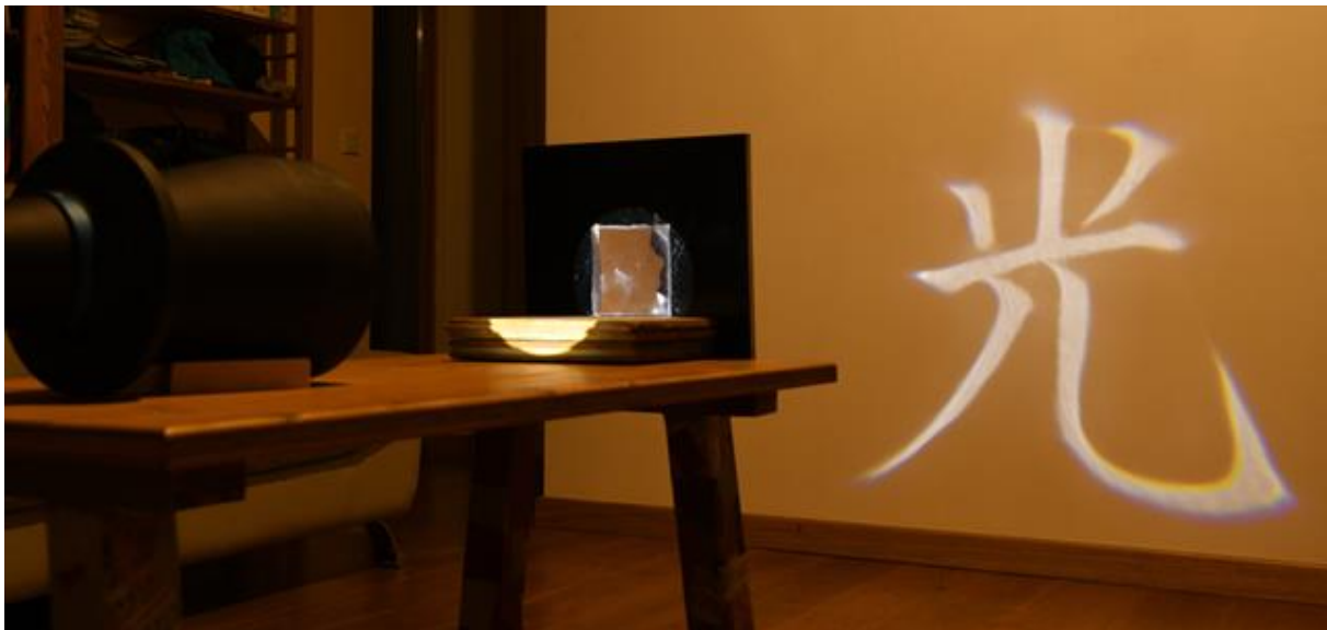
Figure 2 : Prototype physique. La lumière parallèle uniforme (comme les rayons du soleil) se projette sur un mur après réfraction à travers la lentille. La lentille a été conçue de telle manière à ce que l'image projetée forme le caractère japonais Hikari.