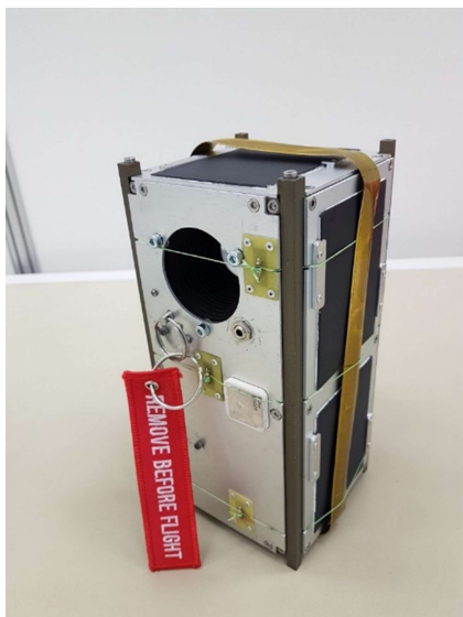
AMICal Sat prêt à être intégré dans sa boîte de lancement (POD)

Initié en 2017 par le CSUG, le projet de nano-satellite AMICal Sat est le fruit d'une collaboration entre une cinquantaine d'étudiants de l'UGA et de Grenoble INP, des acteurs de la recherche, de l'industrie et de la formation de la région Auvergne Rhône-Alpes, en particulier de l'agglomération grenobloise, et le Skobeltsyn Institute of Nuclear Physics de l'Université de Moscou (Lomonosov Moscow State University). Parmi les entreprises impliquées, on compte 6 mécènes industriels réunis par la Fondation UGA (Air Liquide, Teledyne e2v, Nicomatic, Lynred, Gorgy Timing, NPC SYSTEM) et un partenaire industriel polonais (SatRevolution). Les technologies au cœur de ce projet sont issues des laboratoires du site grenoblois : IPAG *[2] / OSUG, CEDMS, IUT1 GMP, S.Mart (ex-AIP DS). La réussite de ce projet repose également sur une forte collaboration avec la communauté radio amateur notamment l' Amsat-Francophone et l' ADRI 38 .